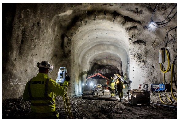
Arbete i tunnel Mälarpassagen.